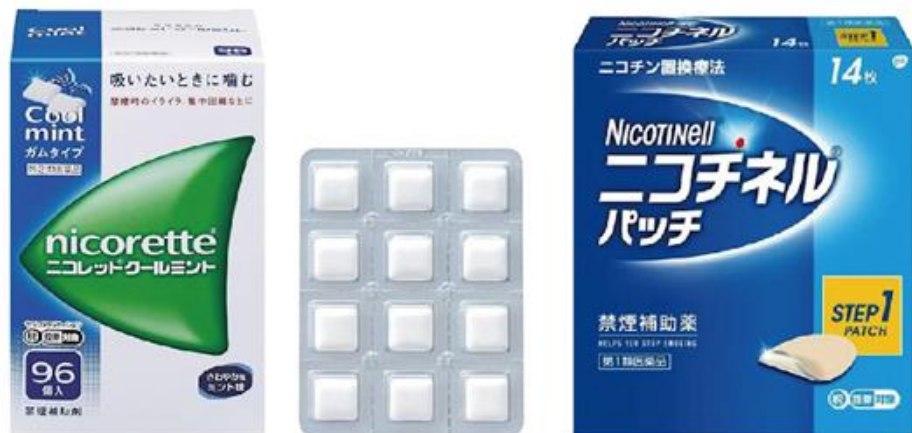
ニコチンガム 吸いたいときに噛む